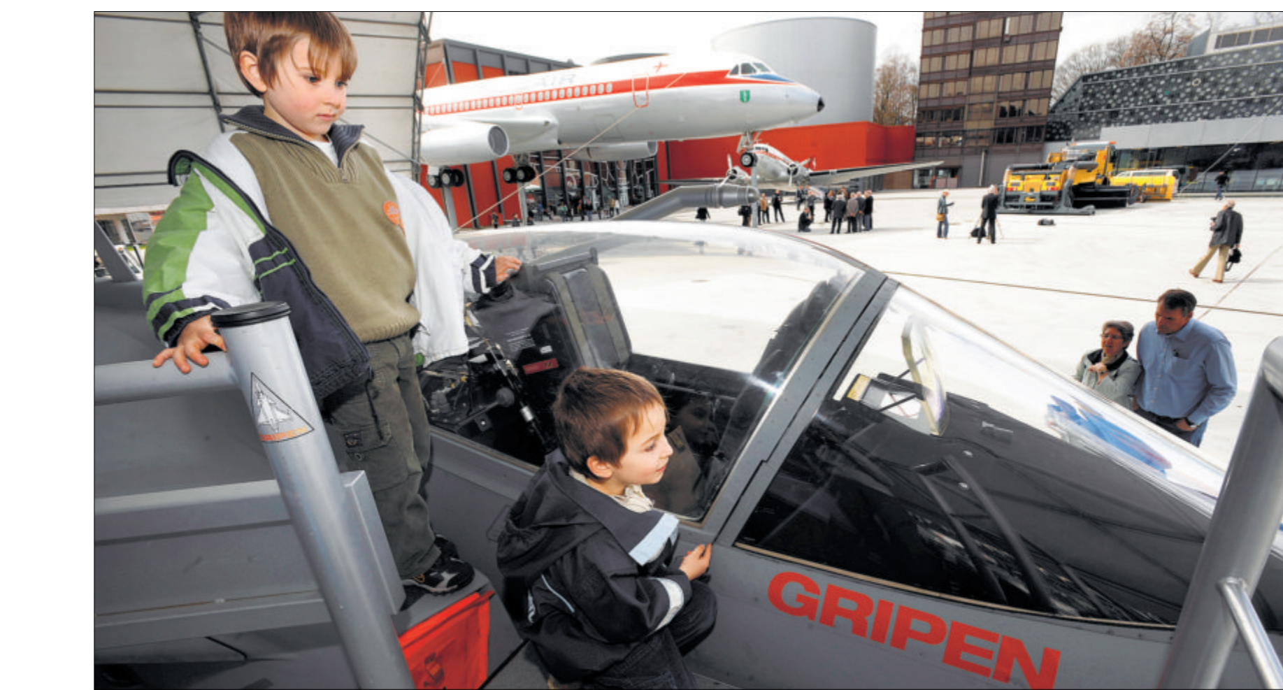
Kinder bestaunen eine Eins-zu-eins-Nachbildung des Gripens, die im März 2010 im Verkehrshaus zu sehen war.

Während die Aversion gegen Kampfflugzeuge in links-grünen Kreisen mit 86 Prozent erwartungsgemäss hoch ausfällt, wie die Umfrage weiter zeigt, überwiegt das Resultat aus der Mitte und dem bürgerlichen Lager (siehe Grafik). Immerhin 37 Prozent der SVP-Wähler halten den Kauf für unnötig. «Das überrascht mich», sagt Ochsenner. Man finde aber sogar in der Luftwaffe Personen, die glauben, der Kauf sei falsch. Sehr oft würde die Beschaffung neuer Jets für eine Berufsarmee diskutiert. «Das ist verkehrt. Man muss über Sicherheit reden.» Auch die Sicherheitspolitikerin Corina Eichenberger