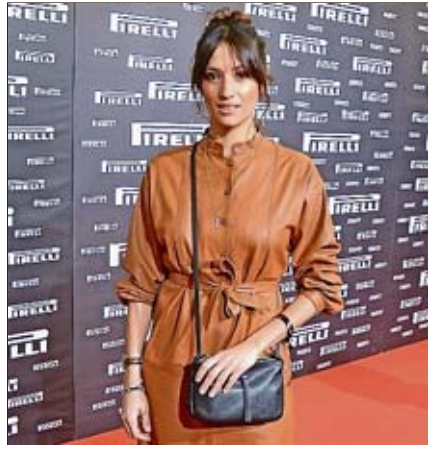
Hochgeschlossen im Lederkleid: Schauspielerin Melanie Winiger.