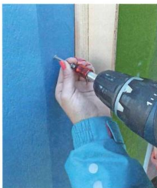
Frauenpower beim Anschrauben.