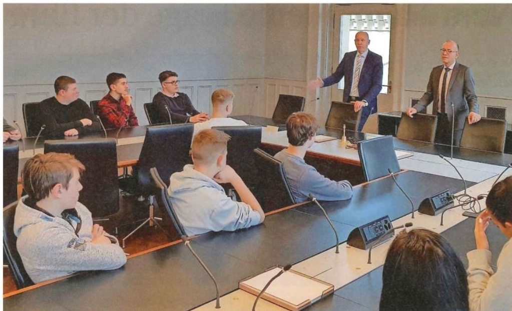
Nationalrat Thomas Hurter (links) und Ständerat Hannes Germann mit Thaynger Schülern im Bundeshaus.